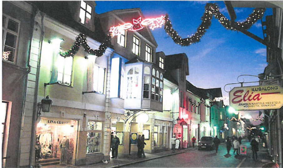
■ Võõras ei aimagi, et Kungla keskuse vana fassaad varjab täiesti uut sisu. Urmas Luik

Hiljem kirjutas leht, et Lamm müüski maja Reesalule, aga omaniku